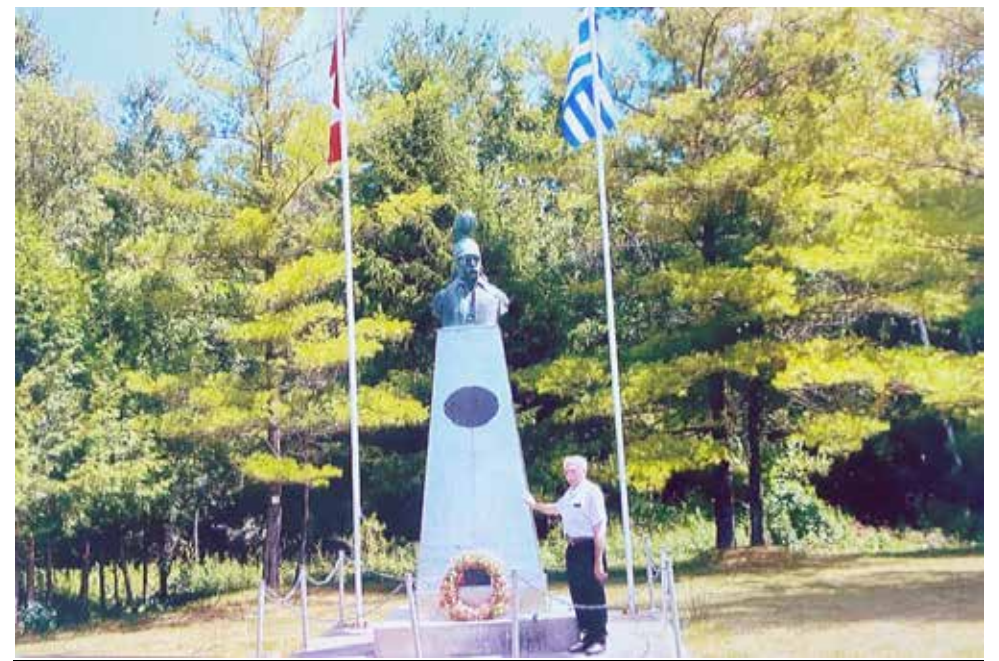
Ένας γνωστός Λεβιδάιος, ο τελευταίος που αποχαιρετά τον ΗΡΩΑ ΤΩΝ ΗΡΩΩΝ καθώς μετά ήρθε η “αποκαθήλωση” του αγάλματος στο γνωστό μέχρι πρότινος Αρκαδικό πάρκο. Η Ιστορία του πέρασε στην σελίδα των Αθανάτων!

Ο Θεόδωρος Κολοκοτρώνης πέθανε στις 16 Φεβρουαρίου 1843 το πρωί, από εγκεφαλικό επεισόδιο, έχοντας επιστρέψει από γλέντι στα βασιλικά ανάκτορα, όπου τα